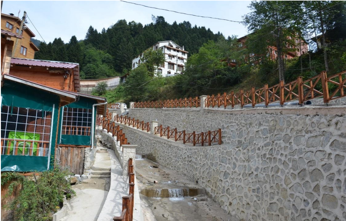
Fotoğraf 6: Kaçkar Dağları MP Ayder Yaylası Huser Deresi Çevre Düzenleme/RİZE