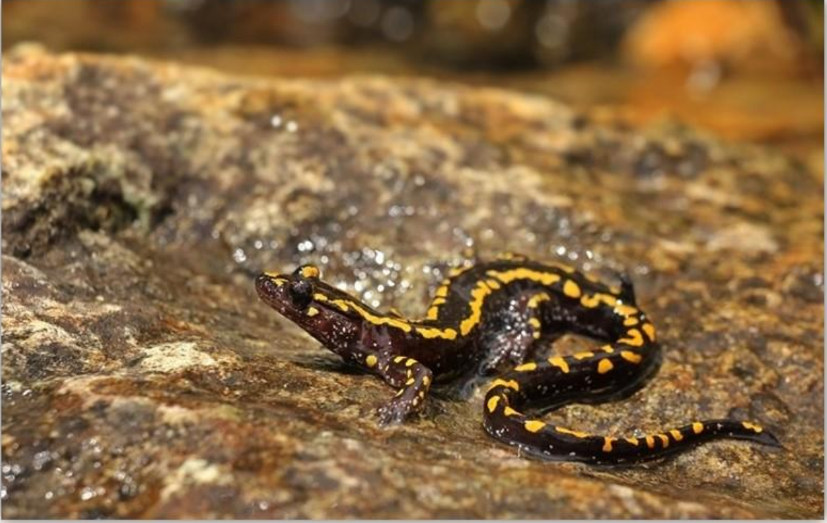
Fotoğraf 1: Tür Koruma Eylem Planı / (Artvin, Giresun, Gümüşhane, Rize, Trabzon illerini kapsayan Kafkas Semenderi ( Mertensiana caucasica ))